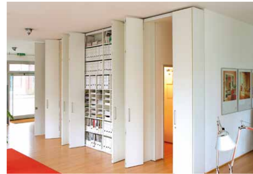
Die klassische Schrankwand. Stauraum - beliebig hoch, breit und tief.

Classic cabinets. Storage space - as high, wide and deep as you like.