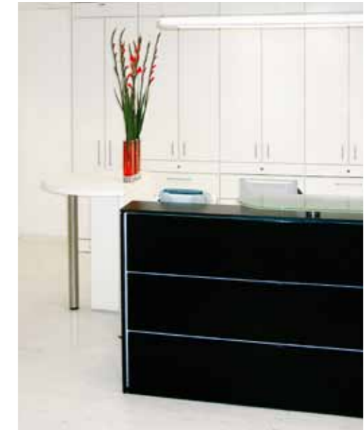
ip20 welcome in Variationen. Variations of ip20 welcome.

ip20 im Beruf. Empfang. ip20 in business. Reception.