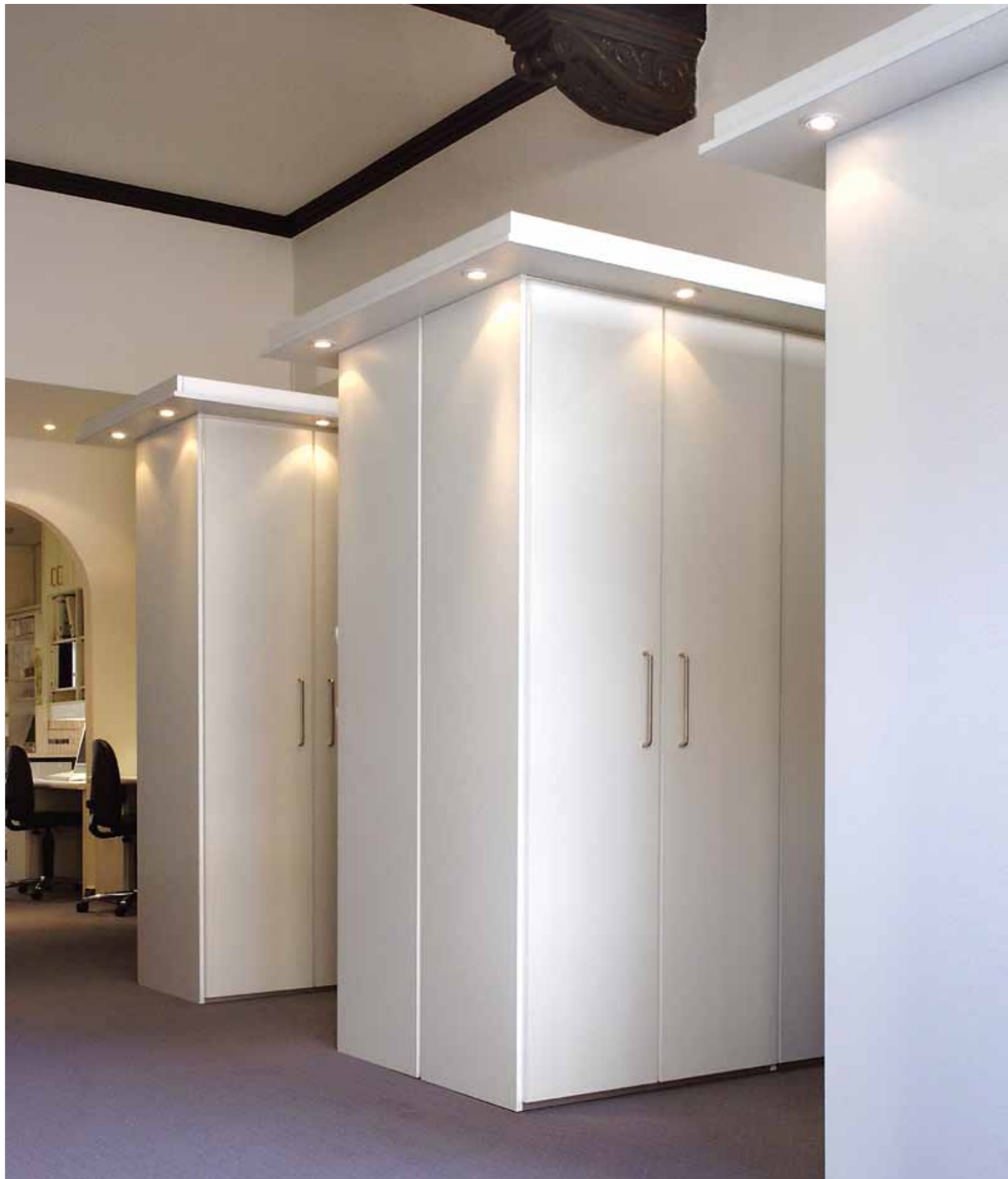
ip20 im Beruf. Schrankraum. ip20 in business. Cabinets.