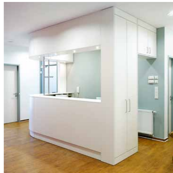
ip20 welcome mit Beleuchtung in abgehängter Decke und im Sockel. ip20 welcome with lighting from floor and ceiling.