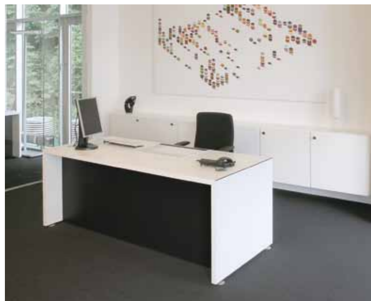
ip20 opendesk auf Wangen. ip20 opendesk with wooden support.

Concentration without compromise. Clear lines, clear minds.