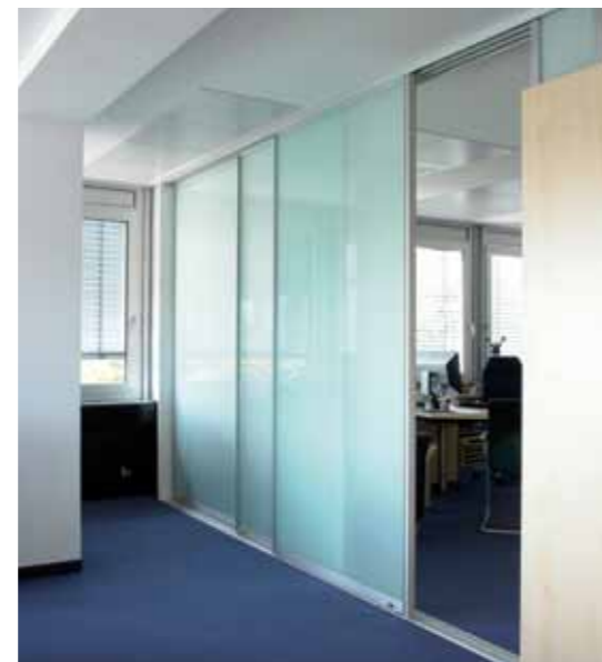
Space 24 (Schieberegale) vor einem Aktenregal. Space 24 (sliding book shelf) in front of file shelf.